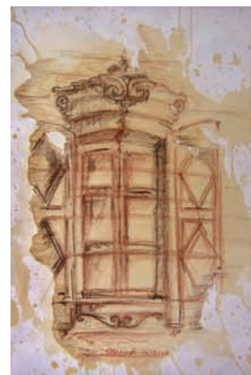
Рисунки из цикла «Архитектурные путешествия по Иркутску» А. Островерхов