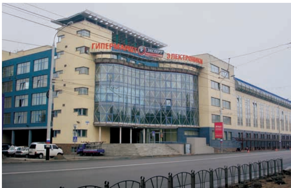
Реконструкция здания Табачной фабрики под офисно-торговый центр по ул. Красный Путь Автор-архитектор: А.О. Седачев

Тем более значительно и объективно прозвучали заключительные слова доклада инве-