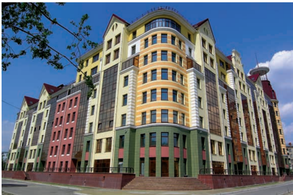
Жилой дом «Старая крепость» Архитектор: А.В. Бегун

Архитектор – профессия синтетическая. В человеке, желающем освоить ее, а затем и профессионально заниматься ею, должны одновременно ужиться вместе: художник,