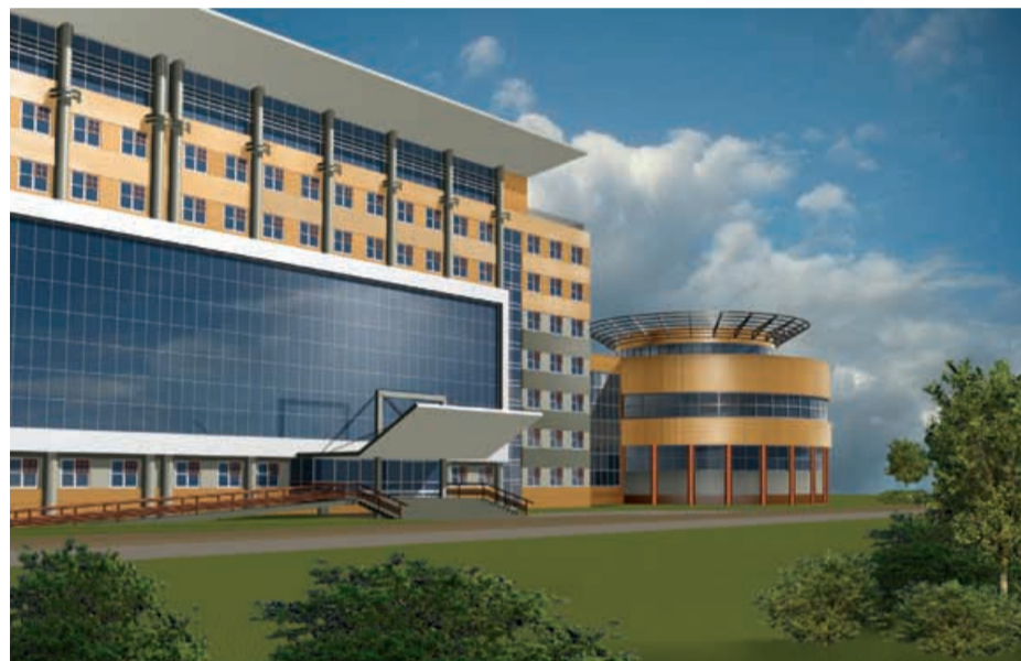
Поликлиника на 1000 посещений в смену по пр-ту Комарова, г. Омск Архитекторы: С.Ю. Гетте, А.П. Гетте

стиционного банкира Аль-Мансура: «...только на основе градостроительных подходов возможно объединить усилия различных инвесторов, чтобы реализовать глобальные проекты, которые могут изменить жизнь к лучшему. Генпланы городов – это стратегия выживания, а город требует тонкого и интеллектуального планирования, в связи с чем архитектура должна стать главной профессией в XXI веке».