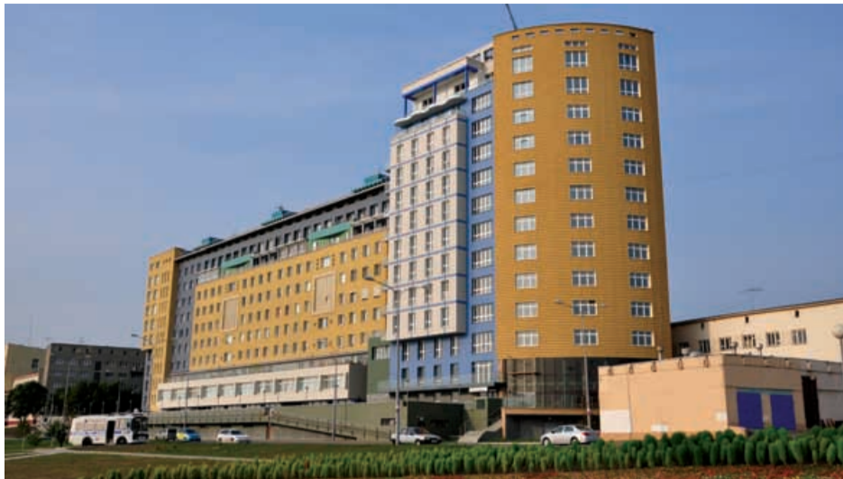
Индивидуальный жилой дом со встроенными офисными помещениями и подземной автостоянкой по Иртышской набережной, г. Омск. Архитекторы: О.Р. Кулагина, О.М. Фрейдин