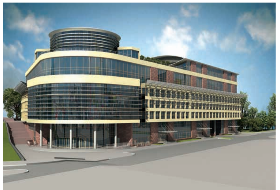
БИЗНЕС-ЦЕНТР по ул. Гагарина-К.Либкнехта Архитекторы: А.П. Гетте, С.Ю. Гетте , г. Омск

1. Необходимо ограничивать предоставление архитектурных услуг корпоративными структурами, в которых размывается конкретная ответственность за творческий