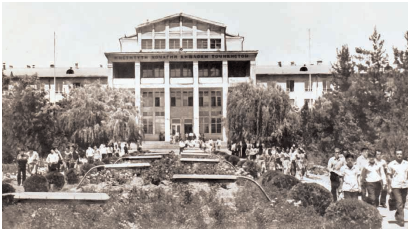
Здание в Самарканде. Узбекистан.

долгое время работавшего с Ириной Вячеславовной. Крупная пластика, характерная для всего здания, имеет отражение и в решении интерьеров. Так, в вестибюле висят пространственные конструкции из стального проката, которые используются для крепления светильников, так же придающие объему крупный масштаб. Это остроумное решение было прекрасным выходом во времена тотального дефицита материалов и изделий, применяющихся в дизайне. Удачно и решение актового зала, а также его акустическое и цветовое решение. В этом зале не раз проходили игры «КВН».