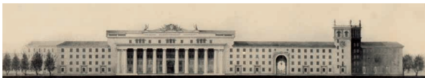
Здание в Башкирии

ет площадь, имеет асимметричное решение: ось главного входа смещена влево, а на изломе здания красуется башня, которая опытному глазу напомнит знаменитую московскую башенку Жолтовского на Смоленской площади. Шаг колонн в середине главного входа увеличен, чтобы подчеркнуть ось. К сожалению, как это часто бывало в истории архитектуры, при строительстве башню «срезали». Эстетические категории нечасто убеждают сильных мира сего. Однако арка высотой в три этажа, служащая в качестве противовеса смещенной оси, была осуществлена в натуре.