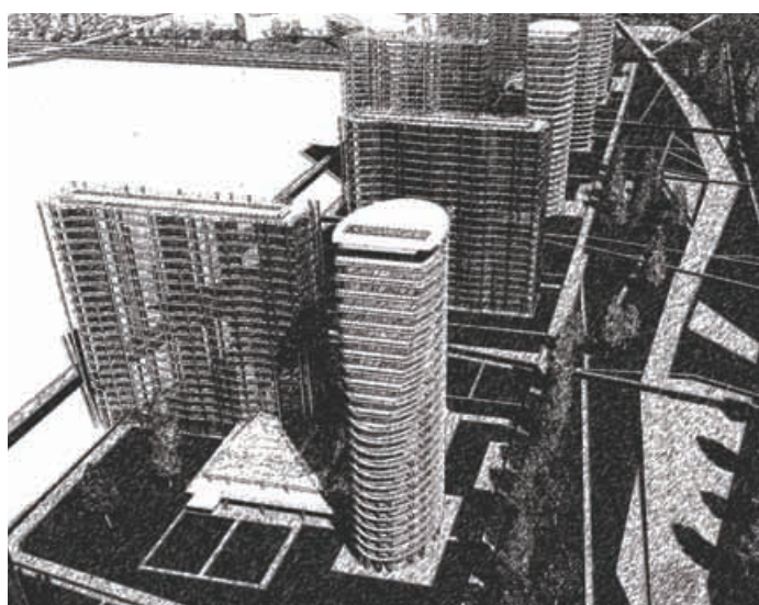
Конкурс на градостроительную концепцию застройки жилого р-на в г. Краснодар, Прикубанский округ