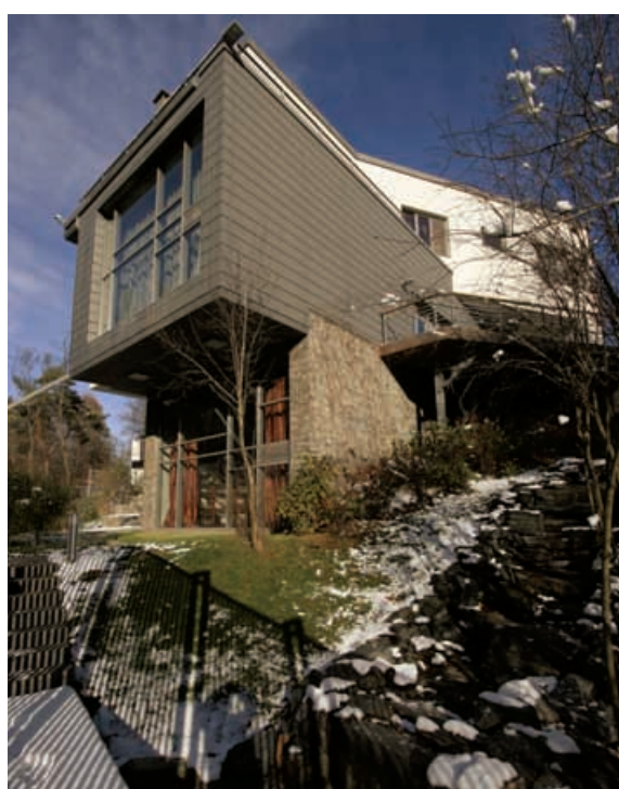
Частный жилой дом Московская обл., Одинцовский р-н, д. Шульгино