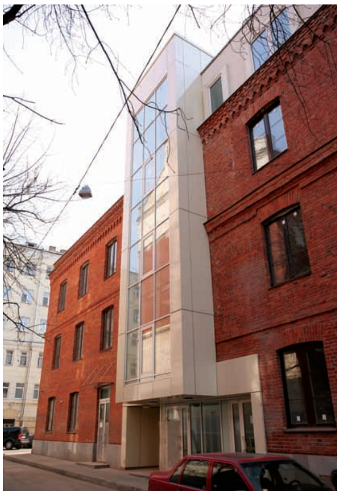
Реконструкция с надстройкой жилого дома г. Москва, ул. Гиляровского, д. 55