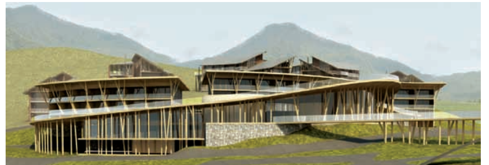
Гольф-клуб, Краснодарский край, г. Сочи