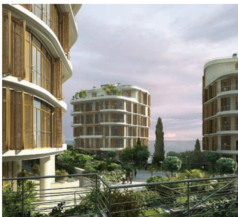
Реконструкция базы отдыха с увеличением вместимости до 98 мест г. Сочи, ул. Политехническая, д. 66