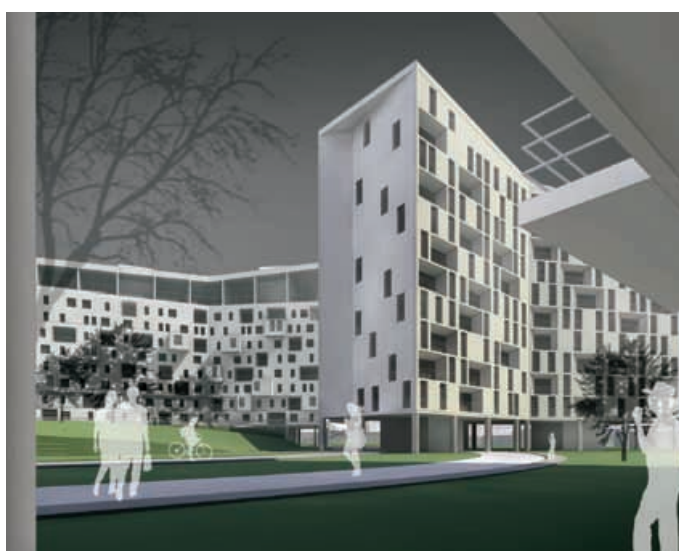
Реконструкция с надстройкой жилого дома г. Москва, ул. Гиляровского, д. 55