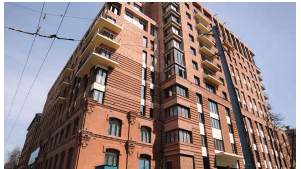
Жилой комплекс «Трилогия», г. Москва, ул. Трехгорный Вал, д. 14, стр. 1