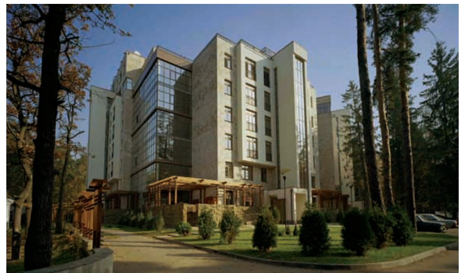
Жилая застройка на территории ФГУП ЛОК «Жуковка», корпуса А и Б по адресу: Московская обл., Одинцовский р-н, пос. Жуковка-1