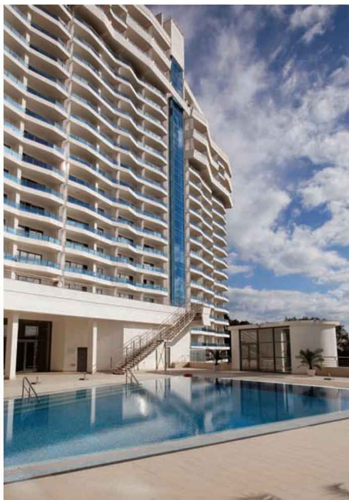
Многофункциональный жилой комплекс с автоматической подземной автостоянкой «Идеал-Хаус», г. Сочи, ул. Бытха