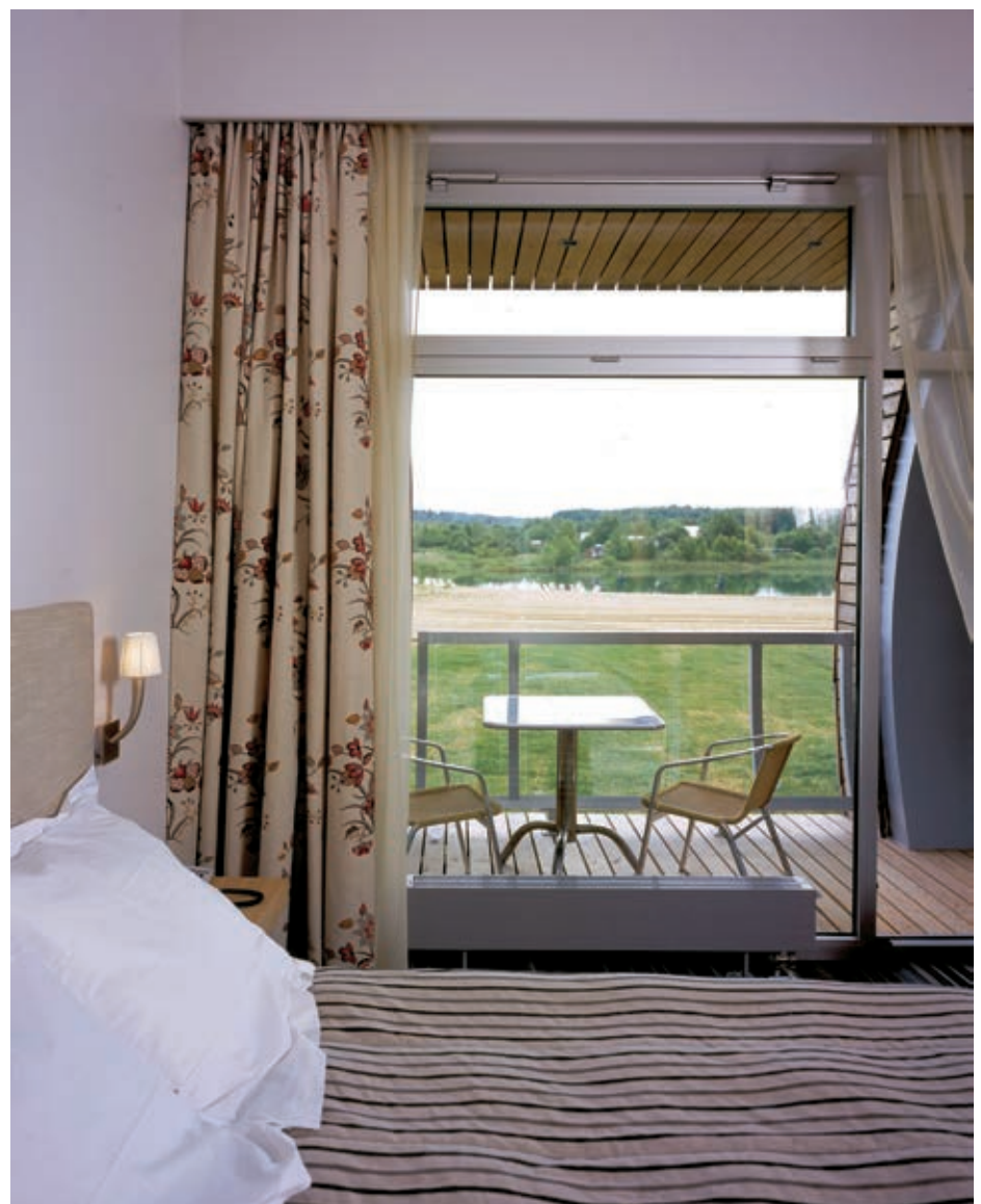
Интерьер в спортивно-стрелковом комплексе «Лисья Нора»