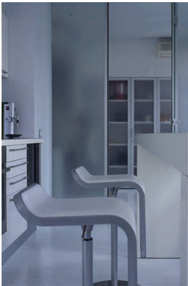
Офис совета директоров компании «Паркет-Холл» г. Москва. 2007 г.

Конечно, успех – это жертвы, это не гармония. Это сложный процесс, который требует организации и кропотливой работы. Тогда, возможно, это будет гармоничный процесс. Даже, несмотря на то, что архитектор – это творческая профессия, зачастую приходится делать не то, что ты бы хотел. Приходится зарабатывать деньги.