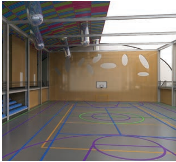
Интерьер школьного зала-трансформера