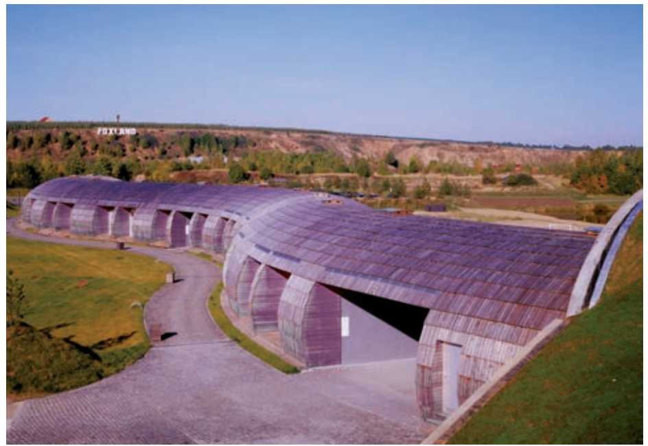
Мотель. Спортивно-стрелковый комплекс «Лисья Нора», 2008 г. Московская обл., Кузьевский С.О., Дмитровский р-он