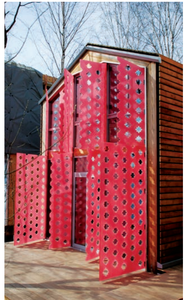
Дом яхтсмена Московская обл., пансионат Клязьминское водохранилище, Пирогово. 2008 г.

Да, именно со стороны мужчин, потому что женщины в этом плане более лояльные, открытые. А мужчины, если говорят комплименты, не понятно, то ли они тебе это снисходительно говорят, как хорошему человеку и как профессионалу, или просто как симпатичной барышне. Очень сложно понять эту границу. Конечно, это проблема не только архитектурной профессии.