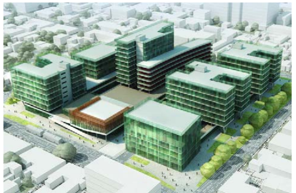
Эскиз застройки квартала № 122, г. Краснодар. 2006