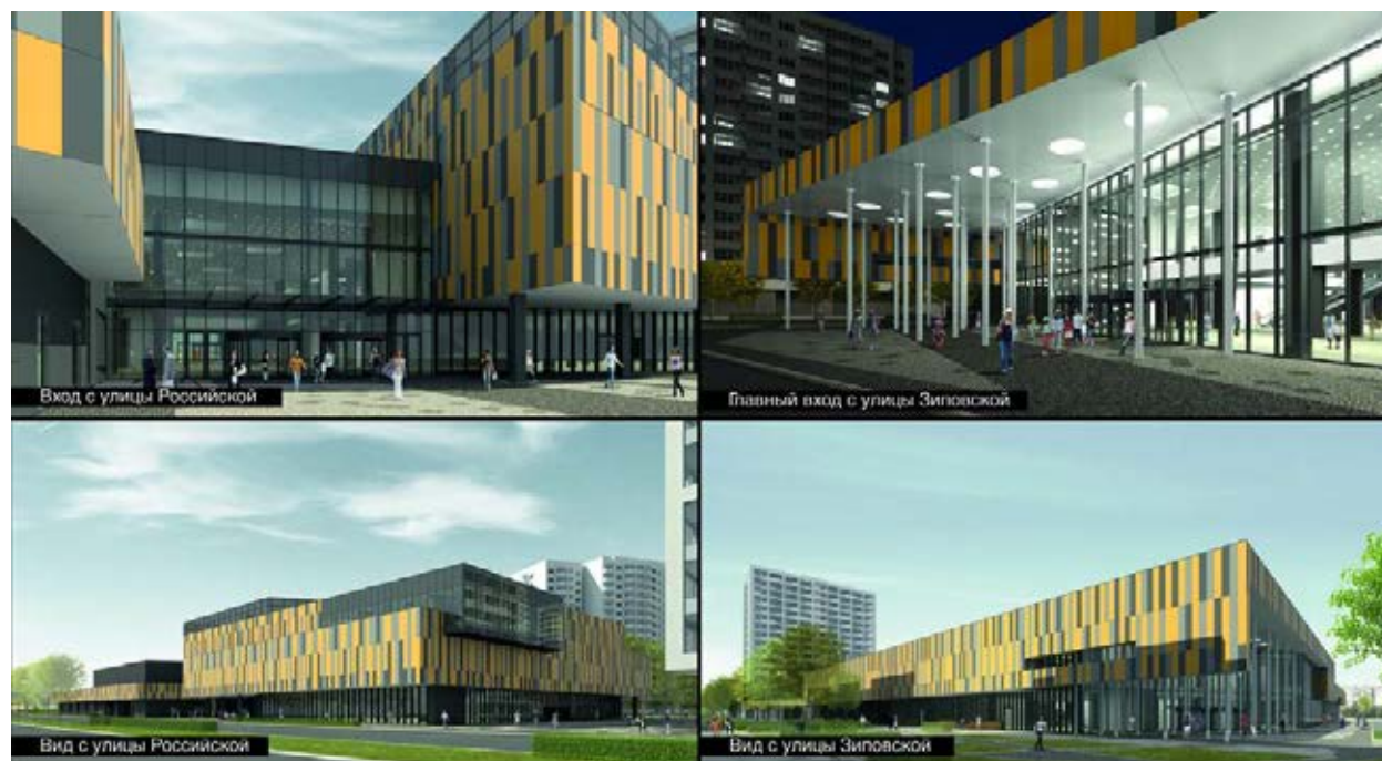
Общественно-торговый центр микрорайона «Московский», г. Краснодар. 2010

Поэтому задача современного архитектора состоит не только в том, чтобы создать гуманную среду, но и в том, чтобы направить коммерческие усилия заказчика в русло профессионально ограниченного гуманизма.