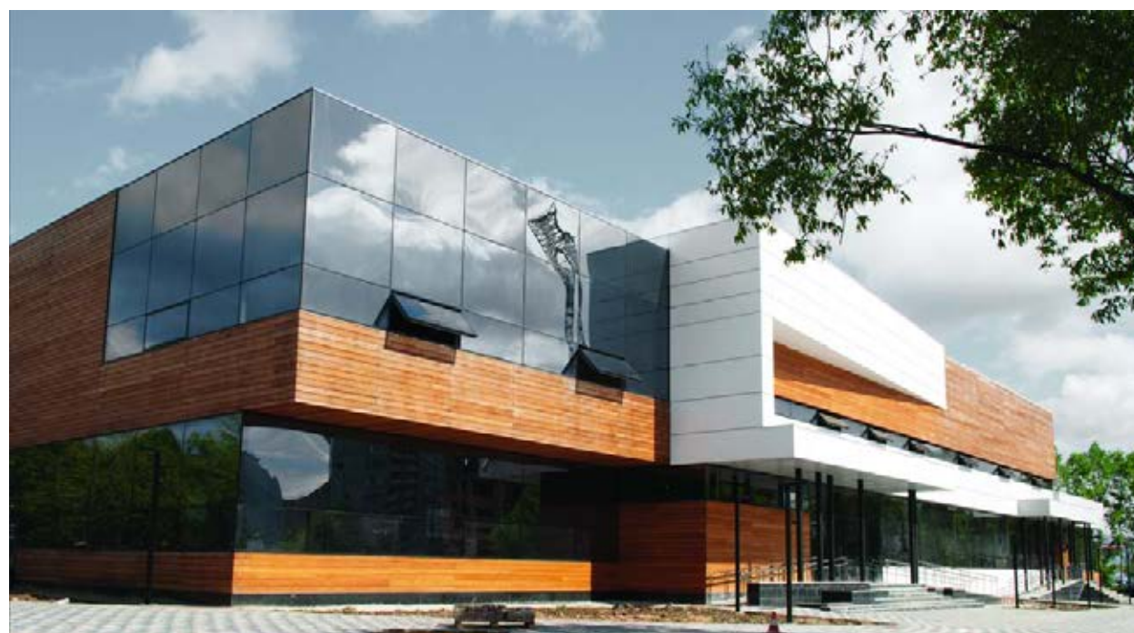
Общественное здание, г. Мытищи. 2009