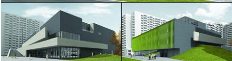
Общественно-торговый центр, микрорайона «Репино», г. Краснодар. 2010