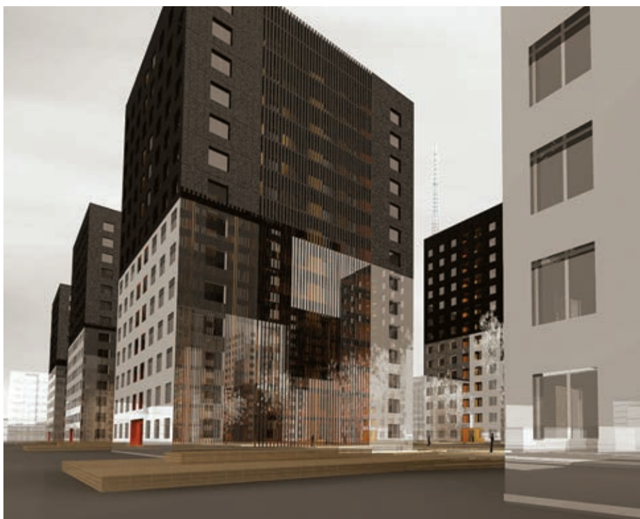
ИГРЫ В НЕВЕСОМОСТЬ